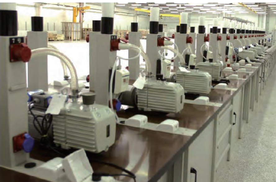
莱宝天津工厂的TRIVAC C生产线

莱宝公司于1850年在德国科隆创建，是世界第一家真空公司，致力于向全球用户提供高品质的真空产品。莱宝天津工厂成立于1997年，自成立以来，产品销往中国及其他亚洲市场并呈现出快速稳定的增长。我们强烈关注生产制造流程，为了保证全球客户对产品的要求，所有产品性能检验设备都是从德国原装进口，所有真空泵均达到莱宝生产标准才能出厂。