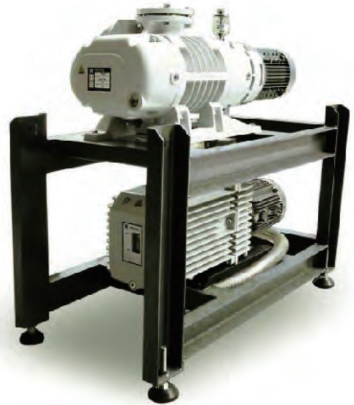
TRIVAC D60C旋片泵和WAU 501罗茨泵组成的真空系统