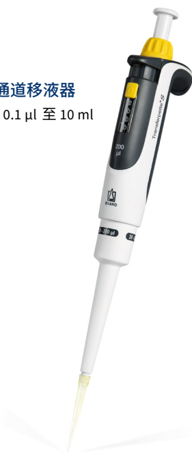
Transferpette® S - 单通道移液器 单通道移液器量程范围：0.1 µl 至 10 ml