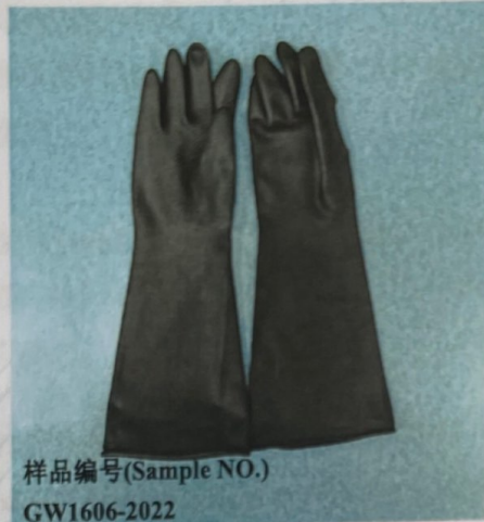
样品编号(Sample NO.) GW1606-2022